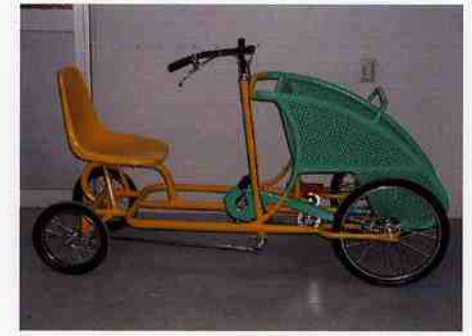
親子カンガルーサイクル

価格 338,100円 寸法 1800×760 前部が座席になっていて親子で楽しめます 2人乗り