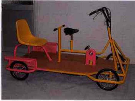
4輪カートサイクル

価格 372,700円 寸法 1880×1210 運転者は前で、チェーンがフレーム下部なので安心です。2人乗り