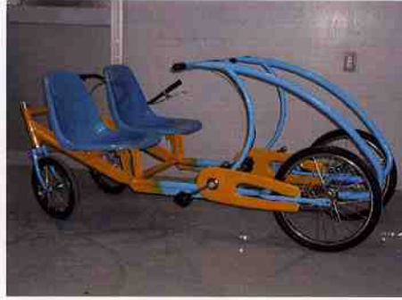
エフエフペアー車