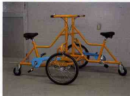
アベックカップサイクル

価格 299,200円 寸法 1860×1100 向かい合わせに乗り息を合わせて前進、後進、回転ができます。 2人乗り