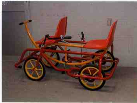
アベックサイクル

価格 302,400円 寸法 1470×970 前に子供を乗せて親子で楽しめます。2人乗り