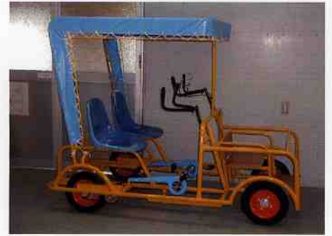
クラシックサイクル

価格 441,000円 寸法 1970×1220 フロント部に子供が二人乗れ親子四人で楽しめます。